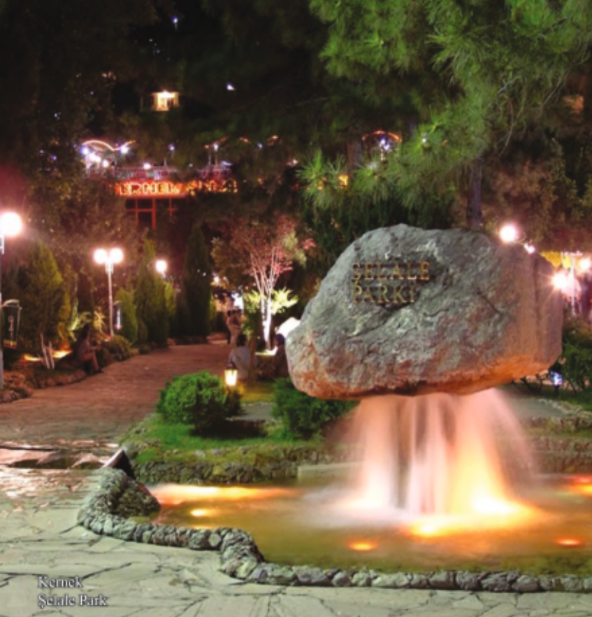
Kemek Şelale Parkı